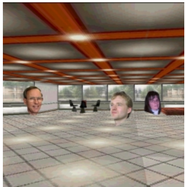
Treffen in virtuellen dreidimensionalen Räumen