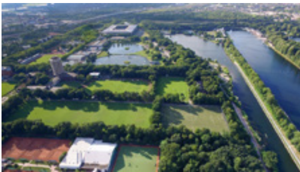
Abb. 7: Sportpark Duisburg-Wedau, https://www.duisburglive.de/ort/sportpark-duisburg/ (Foto: Bernd Uhlen)

„Die Stadt Duisburg unterstützt deshalb Sportveranstaltungen der Sportvereine und Sportfachverbände. Sie geht davon aus, dass neben der Verbesserung des Freizeitwertes der Stadt auch die Selbstdarstellung der jeweiligen Sportart gefördert wird und hieraus neue Aktivitäten und Initiativen erwachsen.“ (Stadt Duisburg, 2012, S. 4)