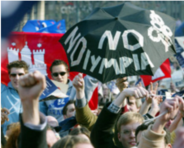
Abb. 4: NOlympia-Protest in Hamburg

Skepsis bspw. bis zum Bürgerschaftsentscheid in Hamburg von den Hauptakteuren entweder nicht ausreichend zur Kenntnis genommen (Wahrnehmungsproblem) oder nicht ernst genommen (Realitätsverweigerung). Wie anders ist es zu erklären, dass der Präsident des Deutschen Olympischen Sportbundes (DOSB) Alfons Hörmann anschließend mitteilte: „Wir waren auf dieses Szenario bis zum heutigen Tag nicht vorbereitet.“ (ZEIT online, 2015)