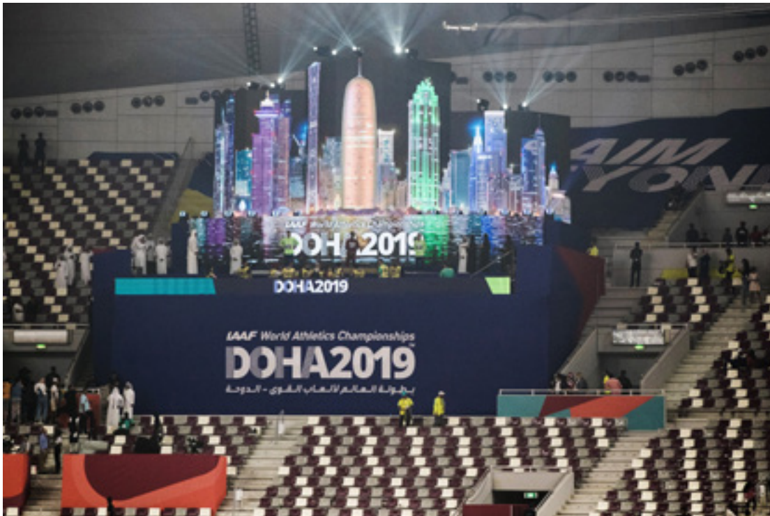
Abb. 8: Siegerehrung vor leeren Zuschauerrängen bei der Leichtathletik WM 2019 in Doha

Pol. Die Stadt veranstaltet für den Sport, für die Gäste des Sports und für sich selbst. Daraus leitet sich unmittelbar der zweite Rang ab: Bürger und Sport-Gäste in den Mittelpunkt stellen.