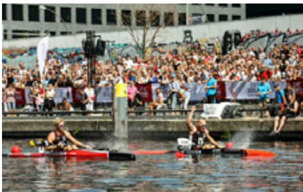
Abb. 5: Deutsche Finals 2019 Kanuwettkämpfe auf der Spree vor der Eastside Gallery

Für die Stadt Hamburg wurde bereits zu einem frühen Zeitpunkt (2002) ein ausdifferenziertes und gut begründetes Konzept vorgelegt. Das ursprünglich als Entwicklungsprofil für die damals anvisierte Olympiabewerbung 2012 entwickelte Konzept geht auf den damaligen Hamburger Sportdirektor (2001-2006) und Sportwissenschaftler Hans-Jürgen Schulke zurück. Anknüpfend an die lange Tradition der Stadt zum englischen Wettkampfsport stehen die Sportarten Rudern, Hockey, Fußball und Reiten begründet im Fokus. Eine weitere Begründung ergibt sich aus der Topographie der Stadt, die insbesondere die innerstädtischen Gewässer zum Ausgangspunkt von Sportgroßveranstaltungen nimmt (bspw. Triathlon) sowie die Stadt als Arena begreift, samt der architektonischen Verbindung mit „baulichen Ikonen“.