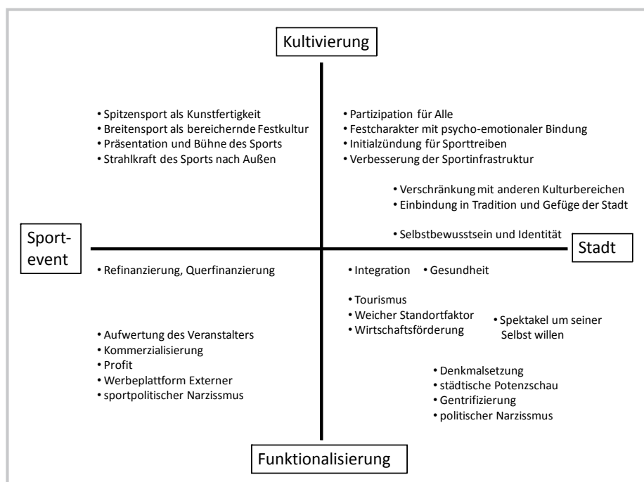
Grafik 4: Sportgroßveranstaltungen zwischen Kultivierung und Funktionalisierung

Insofern sich Städte als Gemeinwesen und nicht als Unternehmen verstehen, sind die großen Veranstaltungen des Spitzen- und Breitensports kein instrumentalisierender Standortfaktor, sondern gestaltender Bestandteil für ein zumindest temporär beglückendes Leben - als Präsentation von Kunstfertigkeit und bereichernder Festkultur.