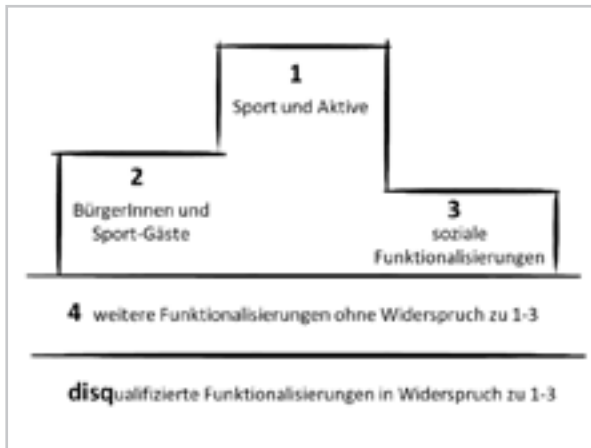
Grafik 3: Rangfolge zu Begründungen und Funktionalisierungen von Sportgroßveranstaltungen

zismus geschuldet sind. Hier stehen Funktionalisierungen im Widerspruch zu den Ebenen 1-3.