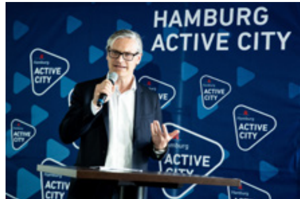
Abb. 6: PK zum Hamburg Active City Plan

reiche „Sportberichte“ publiziert, die im übrigen auch Rechenschaft über die erreichten Ziele abgeben.