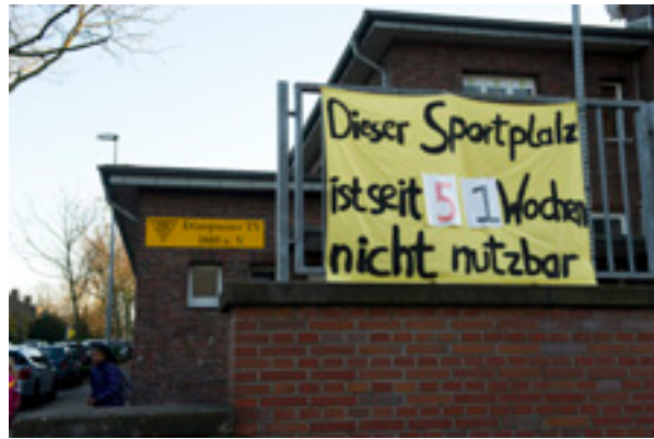
Abb. 2: Sanierungsbedarf kommunaler Sportstätten

Die Thematik betrifft auf einer übergeordneten und grundsätzlichen Ebene die Ausrichtung der Wirtschafts- und Steuerpolitik sowie Fragen der Verteilungsgerechtigkeit, um zu dauerhaften Lösungen für Städte und Gemeinden und damit auch für den Sport zu gelangen. Die völlig unterschiedlichen Entwicklungen haben nicht nur Konsequenzen für die jährlichen Haushaltsetats, sondern beeinflussen auch den Zustand der Sportinfrastruktur. Im jüngst vorgelegten „Kommunalpanel 2019“ wurde ein Investitionsbedarf für Sportstätten und Bäder in Höhe von 8,8 Mrd. € ausgewiesen 3 . Der erneute Anstieg des Investitionsbedarfs zu 2018 (8,3 Mrd. €) betrifft überproportional Städte mit mehr als 50.000 Einwohnern und unter den Bundesländern insbesondere Nordrhein-Westfalen (NRW). (DIfU 2019, S. 11) Die Landesregierung Nordrhein-Westfalen hat inzwischen auf den jahrzehntelangen Sanierungsbedarf der kommunalen Sportstätten, die zahlreichen Medienberichte und lokalen Proteste reagiert. In bemerkenswerter Offenheit führte Ministerpräsident Laschet dazu aus: „Wir in Nordrhein-Westfalen haben da leider einen enormen Sanierungsbedarf. Viele Jahrzehnte ist zu wenig passiert.“ (NRW 2019) Allerdings kann selbst das löbliche Förderprogramm in Höhe von 300 Mio. € lediglich einen Teil des bestehenden Sanierungsbedarfs in Höhe von knapp 2 Mrd. € beheben.