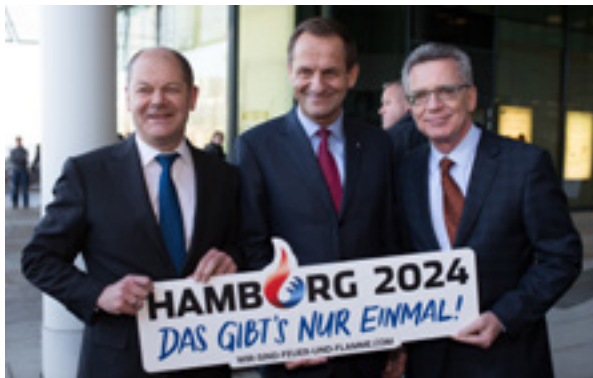
Abb. 3: Großes Interesse aus der Politik an Sportgroßveranstaltungen

Durch die Akzeptanz einer nationalen wie globalen Städtekonkurrenz seitens Politik, Stadtmarketing und Sportagenturen werden Sportgroßveranstaltungen zunehmend als weicher Standortfaktor wahrgenommen und benutzt. Insofern richtet sich der Blick vornehmlich auf die zu erzielenden Imageeffekte auch im Hinblick auf die ökonomisch attraktiven Zielgruppen der so genannten High Potentials (Steuerzahler), die Kreativszene (Aufwerter) und Städtetouristen (externe Kaufkraft). In dieser Konsequenz gerät der sportkulturelle Kern der Veranstaltung zusehends in den Hintergrund. Daher geht es vielfach nicht mehr primär um die Förderung und Weiterentwicklung des jeweiligen Sports, sondern um die Funktionalisierung der Veranstaltungen für städtische Marketingzwecke und Partialinteressen.